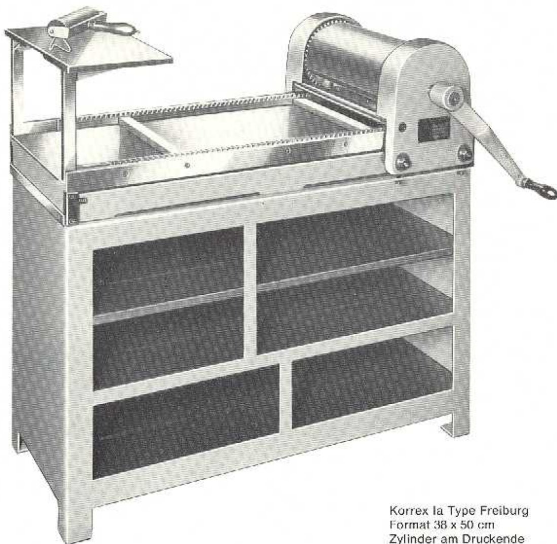
Korrex Ia Type Freiburg Format 38 x 50 cm Zylinder am Druckende

Eine sauber und präzise gearbeitete Andruckpresse ohne Greifereinrichtung und ohne Farbwerk. Kräftiges Druckfundament und Druckzylinder. Spielend leichter Gang des Druckzylinders bei hoher Vorspannung. Außerordentlich druckstark. Beim Aufzugmachen bequem zugänglicher Druckzylinder. Schrägverzahnte Zahnräder und Zahnstangen. Genauigkeit zwischen Druckzylinder und Druckfundament 0,01 mm. Sauber geschliffener Farbtisch. Die Maschine hat mit sog. „Nudeln“ nichts zu tun. Maß zwischen den Zahnstangen 38 cm.